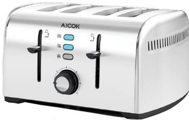
4 Fentes 4 Tranches Grille-Pain Modèle: ST-525 220-240V; 50/60Hz; 1400-1700W